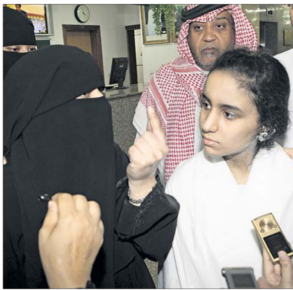
والدة طالبة تتحدث عن الحادثة إلى الصحفيين.

تفعيل دور لجان مواجهة الطوارئ في مدارس البنات