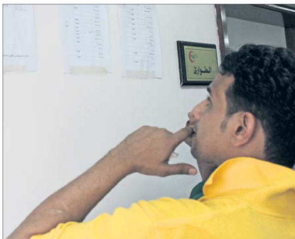
ولي أمر يديق أسماء المصابات في قسم الطوارئ.