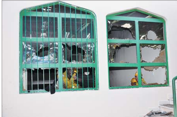
منافذة موصدة بالحديد وأخرى بعد كسر القضبان.