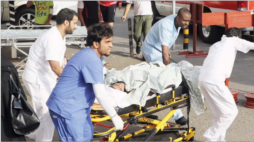
وصول حالة حرجة إلى المستشفى.