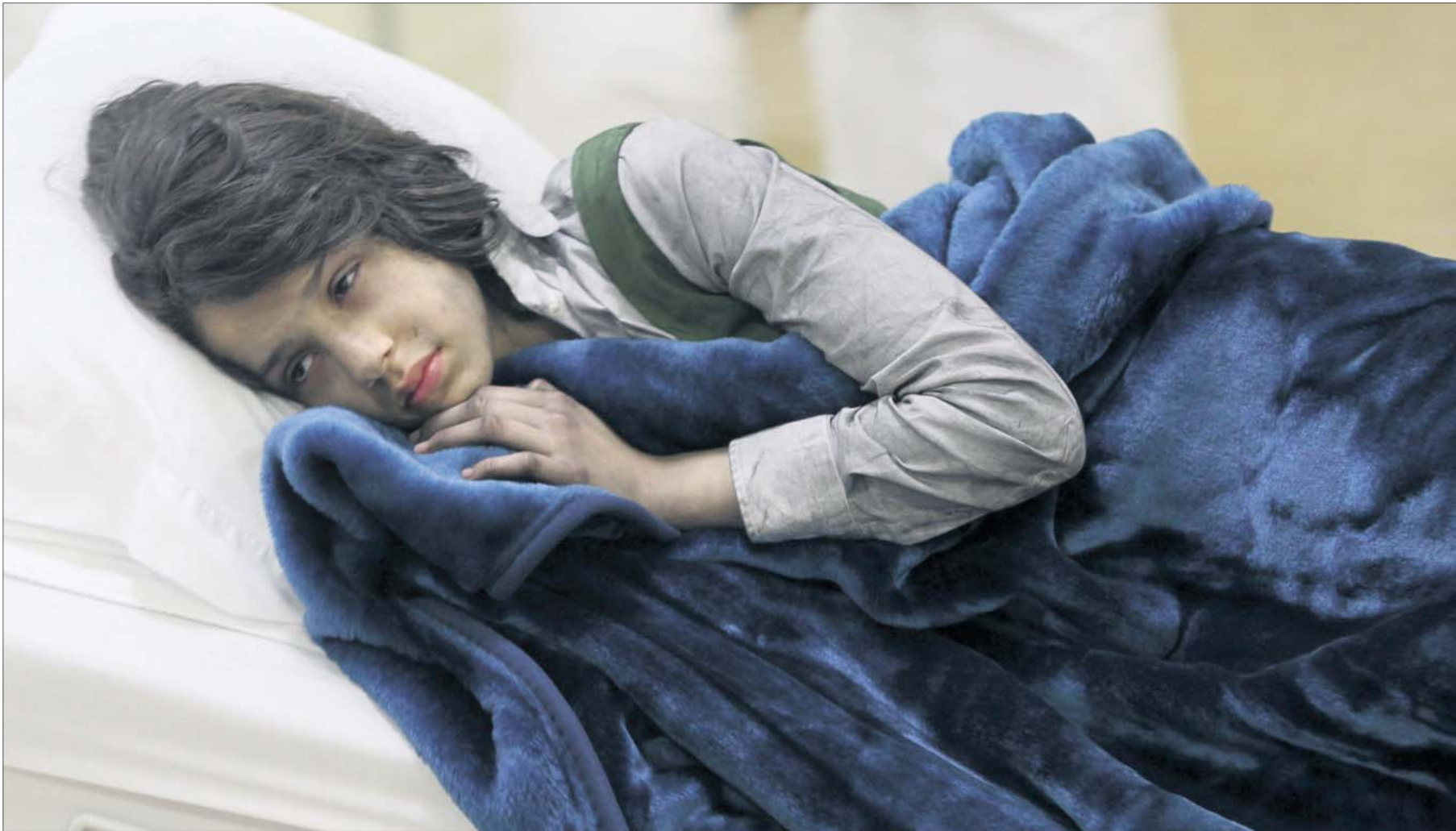
طالبة من مدرسة براعم الوطن ترقد على السرير الأبيض في مستشفى الجدة في جدة أمس.

بأمراض في القلب، أما عن صرفها على أسرته فإنها سخرية في الصرف لدرجة أنها تنسى نفسها حين إنفاقها عليهم وتحبهم حباً شديداً. كان مهما وشغلها الشاغل توفير حياة كريمة لأسرتها ودفع إيجار الشقة الذي أثقل كاهلهم، فقد كانت تحمل أسرته خصوصاً بعد وفاة والدتها رمضان الماضي.