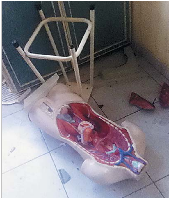
جانب من معمل المدرسة أثناء الحريق.