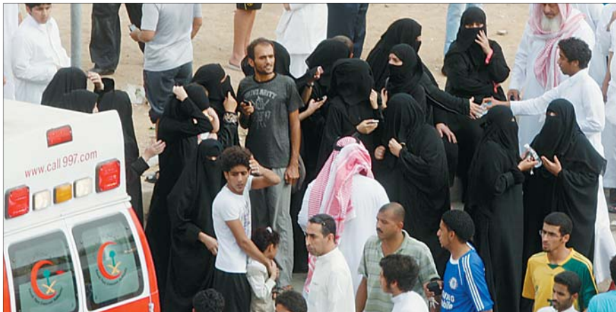
أهالي طالبات في ساعة القلق.

غادرت الطالبات ومعلماتهن منازلهن بسببحة أمس على أمل العودة، كذلك معلمة حملت أن تقوم لابنائها تطهو لهم وجبة الغداء فيما كانت الفتيات أن يدهن أي من منازلهن يباحثن عن أحضان أمهاتهن، ولقمة سائفة بعد غداء يوم دراسي مرهق، إلا أن النار البت أن تتحرق أحلام الصباح. دق الجرس لم ين معنا "الفسحة" أو الانصراف، بل ناقوس الحريق معلنا اندلاع النار في مدرسة براعم الوطن الأهلية، بدد الهلع وسباق الطلبة الهلب الهلب التي أتت على المكان فخلوته شبيها، وبدأت تنطلق بشراهة نحو أجساد الطالبات الخجولة التي تنطق الصمود في