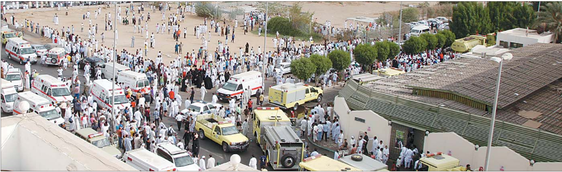
جانب من ساحة حريق المدرسة في جدة أمس

فحص كل وسائل السلامة ومدى فاعليتها. وذكر مدير الدفاع المدني في جدة أنه وفرت وسائل للقفز لكن ضيق المساحات والمظلات الخشبية أزمت الموقف، إضافة لحالة الهلع التي أصابت الطالبات والمعلمات على حد سواء. من جهته، قال اللواء عادل زمزمي مدير الدفاع في منطقة مكة المكرمة إن فرق التحقيق بدأت في التحقيق الفوري وستعلن النتائج خلال الساعات القليلة المقبلة. وأوضح مدير عام التربية والتعليم في محافظة جدة عبدالله الثقفي أن المدرسة تخضع للإشراف من قبل إدارته، مؤكدا تسجيل حالات إصابات بلغت ٥١ حالة، وتم إشراك فريق طبي من الوحدة الصحية المدرسية عمل إلى جانب فرق الإسعاف من صحة جدة. وأبان الثقفي، أن المعلمات نجحن في تصعيد الطالبات إلى الأدوار العليا وهو ما ساهم في خفض حالات الإصابة والوفاة من جراء الحريق، مؤكدا تشكيل فريق تحقيق من قبل إدارته بهدف كشف أي قصور في الموقع أو خلل.