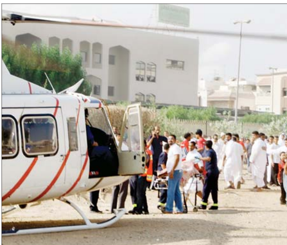
حالة منقولة بطائرة الهلال الأحمر.