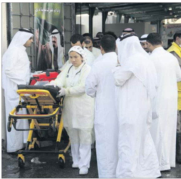
مواطنون أمام بوابة طوارئ المستشفى عند نقل الطالبات.

والمباني على الطالبات. وأوضحت المصادر أن لجان مواجهة الطوارئ ستضع آلية مدروسة بين مختلف الجهات الشرعية، والصحية والأمنية، للتعامل مع حالات الطارئة التي تقع داخل مدارس البنات ابتداء من تلقي البلاغ حتى انتهاء المهمة لتأمين السلامة والأمن. وبدأت اللجان المشكلة بتنظيم عدد من الدورات التأهيلية