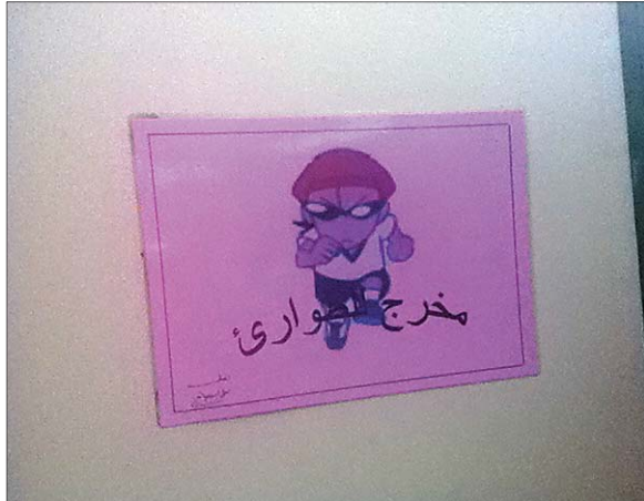
علامة مخرج الطوارئ كما بدت ملصقة على باب معمل المدرسة.