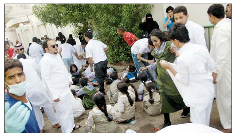
طالبات ساعة الإنقاذ