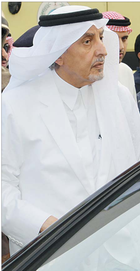
الأمير خالد الفيصل لدى وقوفه على تفاصيل حادثة حريق المدرسة.