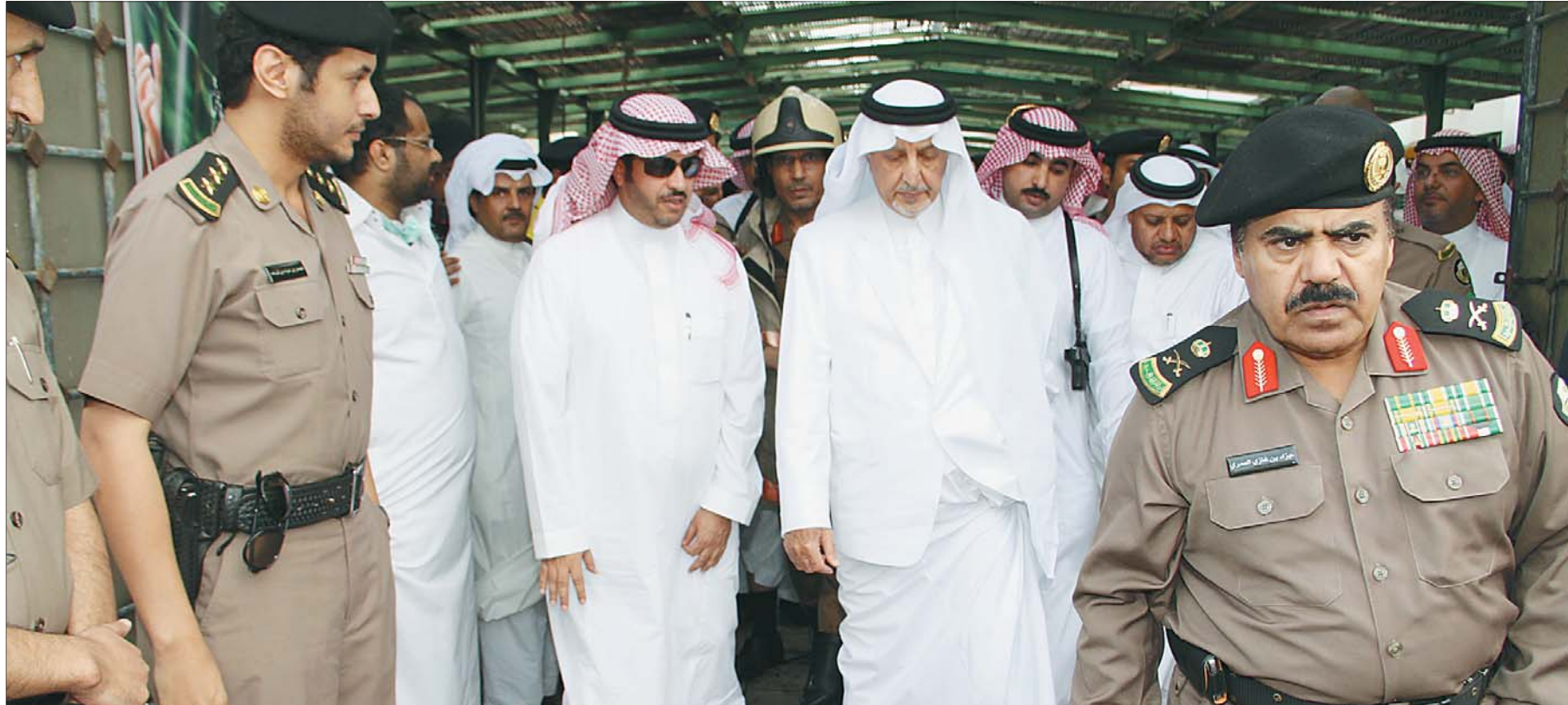
الأمير خالد الفيصل متفقدًا المدرسة المنكوبة في جدة أمس، حيث وصلها مباشرة من مكة المكرمة.