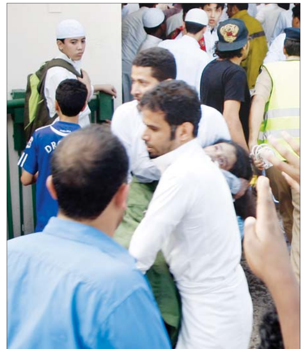
شاب متطوع ينتشل طفلة من الحريق.

وما إذا سيتم تشكيل لجنة للتحقيق في الحادثة، أكد أنه سيطلع على تقرير الدفاع المدني أولا، ومن ثم سيتم تحديد باقي الخطوات، وذلك قبل تشكيل لجنة مختصة.