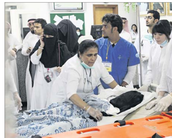
مرمضة تسعف معلمة في قسم الطوارئ.