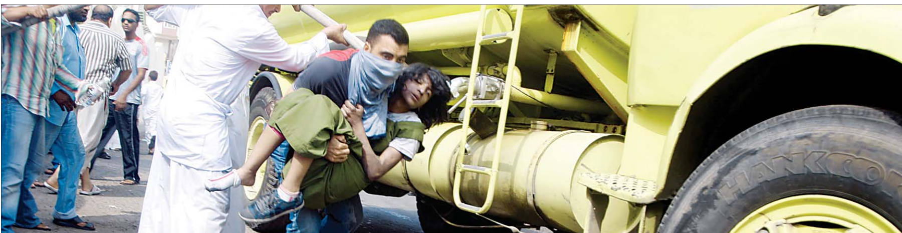
حالة إنقاذ لطالبة.