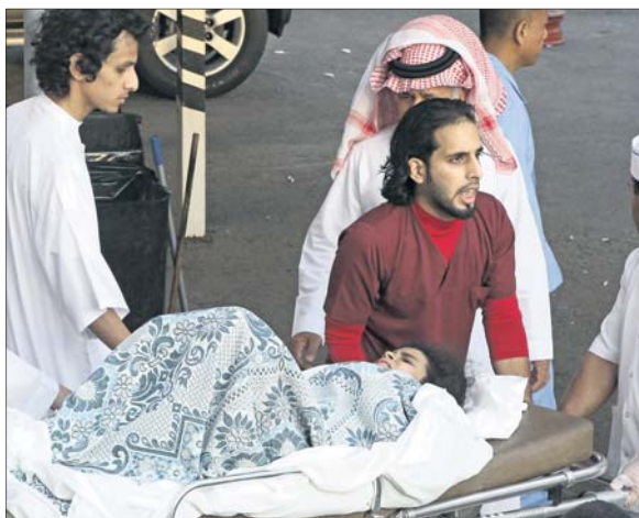
.. ومواطن يسعف ابنته إلى المستشفى.