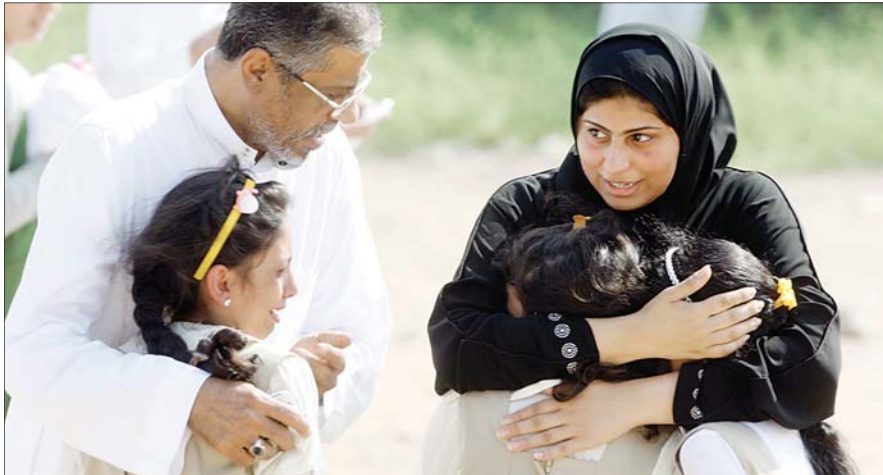
أب وأم يحضنان بناتهما ساعة إنقاذهن من حريق المدرسة.