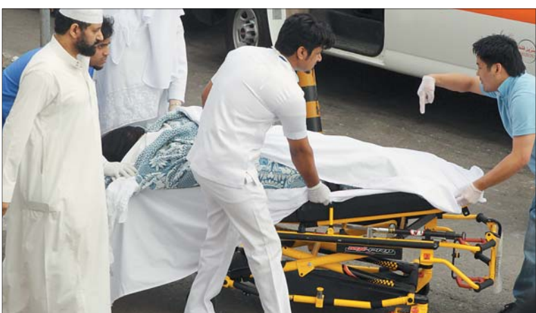
معلمة مصابة باتجاه المستشفى