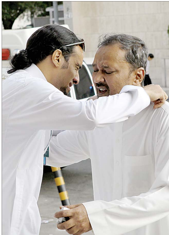
أب يبكي طفلته في المدرسة ساعة الحريق.