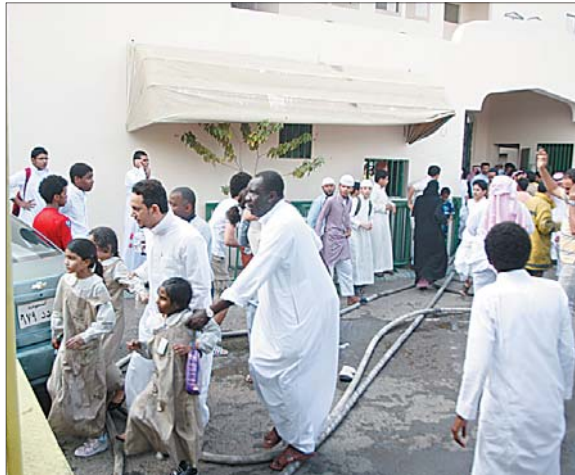
جانب من إخلاء الطلاب من المدرسة المنكوبة.