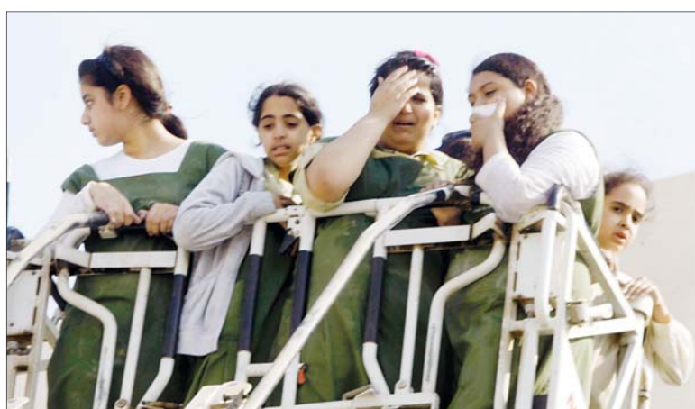
رافعة الدفاع المدني لحظة إجلاء طالبات من الحريق.