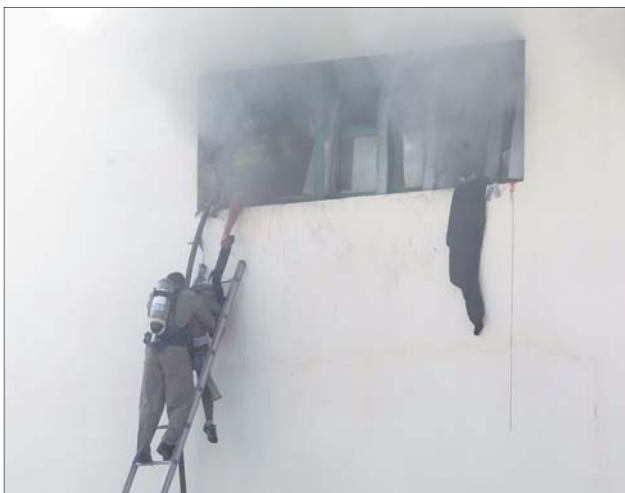
عباءة تتدلى وإنقاذ طفلة بواسطة الدفاع المدني