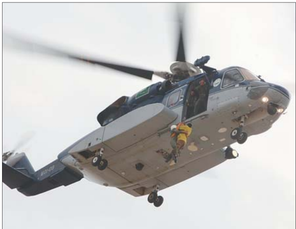
عملية إنقاذ جوي فوق مبنى المدرسة.