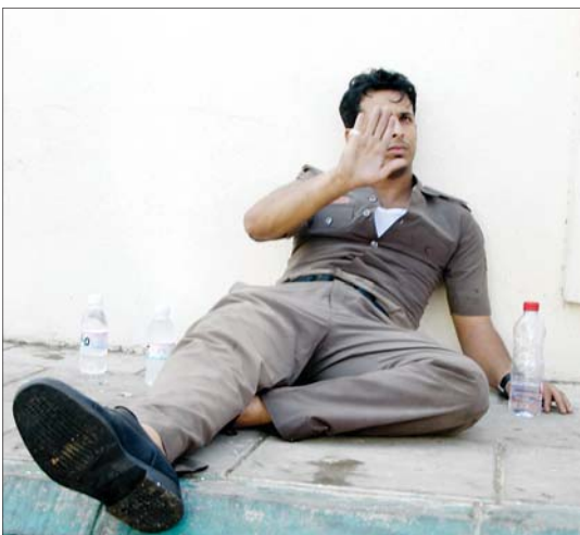
أحد المنقذين وقد أعياه الدخان.