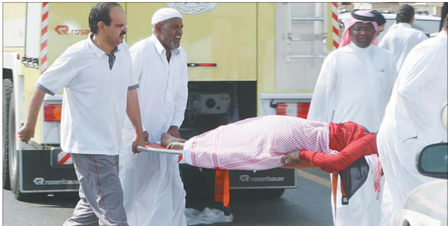
متطوعون ينقلون معلمة إلى الإسعاف.