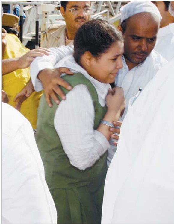
أب يحتضن ابنته الناجية من الحريق.