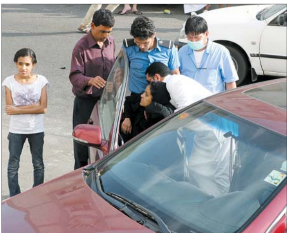
طالبة مصابة لحظة وصولها المستشفى.